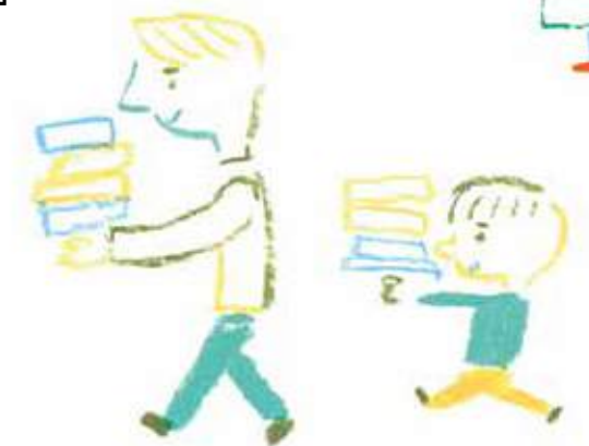
表紙イラスト◎北村人